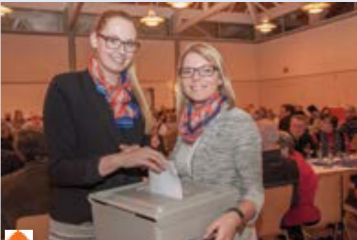
Das Einsammeln der Wahlzettel übernehmen unsere Mitarbeiterinnen und Mitarbeiter sehr gerne