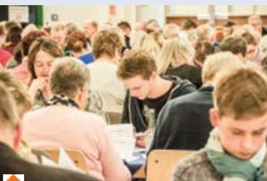
Die teilweise sehr umfangreichen Kandidatenlisten erfordern die ganze Aufmerksamkeit