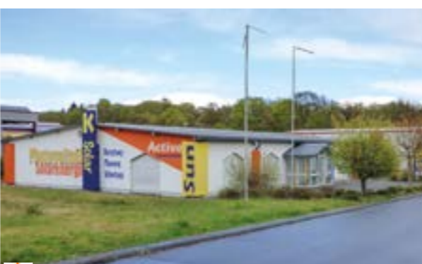
Lager- und Ausstellungshalle mit Büroräumen in Breitscheid-Nassen Objekt: W103