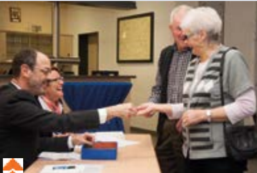
Ordnung muss sein: Wahlberechtigung wurde geprüft