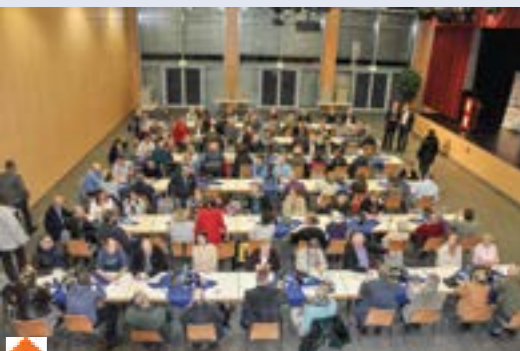
Full House heißt es nicht nur im Forum Windhagen, in dem wir 114 Wähler begrüßen konnten