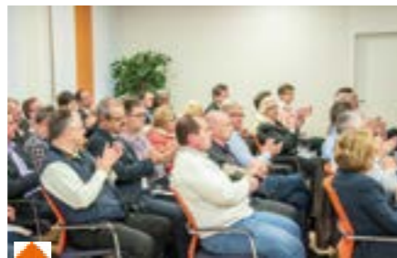
Anerkennender Applaus für unsere Gastreferenten

Nach einer ebenfalls positiven Bewertung der Veranstaltung durch unseren Firmenkundenbeirat - auf dessen Initiative das Angebot entwickelt wurde - halten wir bereits Ausschau nach geeigneten Themen für eine Folgeveranstaltung. Gerne lassen wir uns dabei auch durch Ihre Anregungen unterstützen.