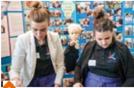
Auch Friedrich Wilhelm Raiffeisen von „Genossenschaften sind Regionalhelden“ schaut vorbei